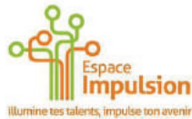
Espace Impulsion Partenaire