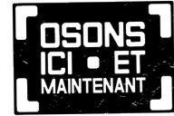
Osons Ici et maintenant Partenaire